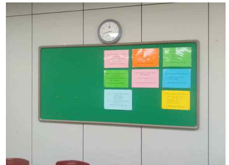
지역건설공학전공 107호 강의실 게시판