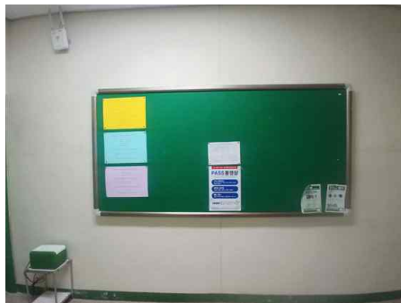
지역건설공학전공 복도 게시판