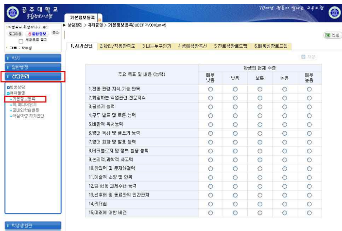
(Future Plan의 기본정보 등록방법)